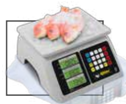
Ideal para pescaderías