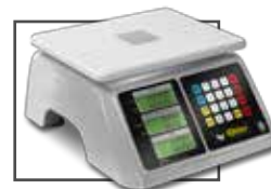
Incluye mica protectora