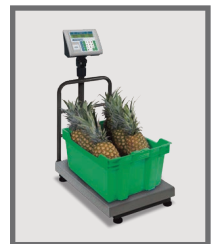
Puede usarse para despacho y recibo de mercancía

SERVICIO Y REFACCIONES DISPONIBLES Contamos con una red de centros de servicio en toda la república: rhino.mx/servicio.html